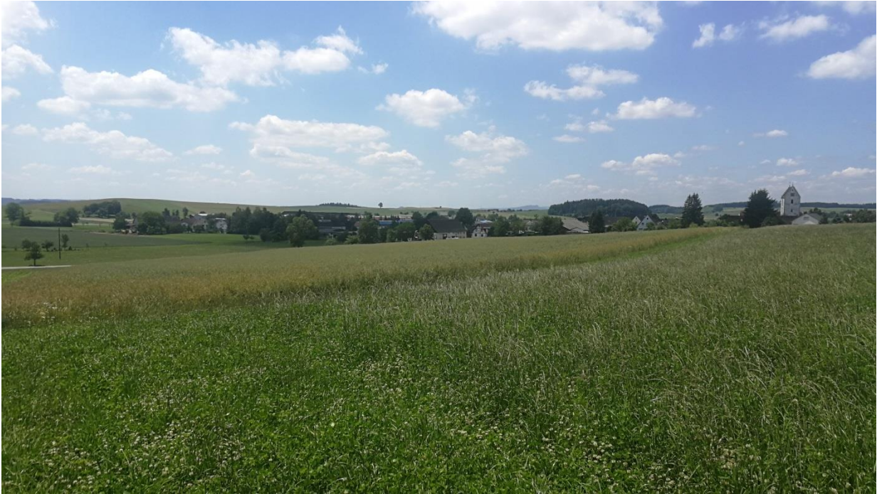
Abbildung 6: Blick vom Plangebiet in Richtung Süden.