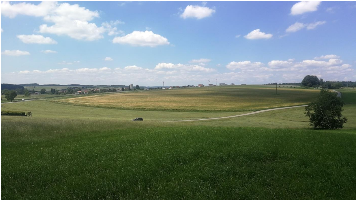
Abbildung 5: Bruthabitate der Feldlerche östlich von Liggersdorf.