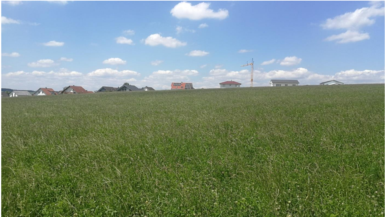
Abbildung 4: Geplantes Baugebiet östlich der Ortschaft Liggersdorf.