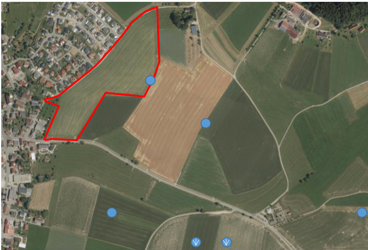
Abbildung 3: Nachweise der Feldlerchen (blaue Punkte) im unmittelbaren Umfeld des Bebauungsgebietes. Rote Linie = Geltungsbereich des Bebauungsplans „Röschberg Süd“. Quelle: Daten- und Kartendienst der LUBW, abgerufen am 09.12.2020, unmaßstäbliche Darstellung.