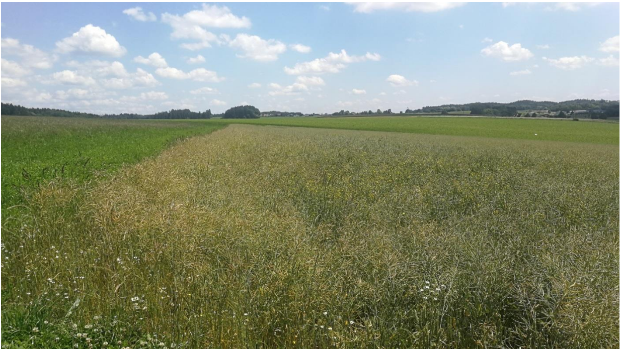
Abbildung 7: Angrenzende Flächen östlich des Plangebietes.