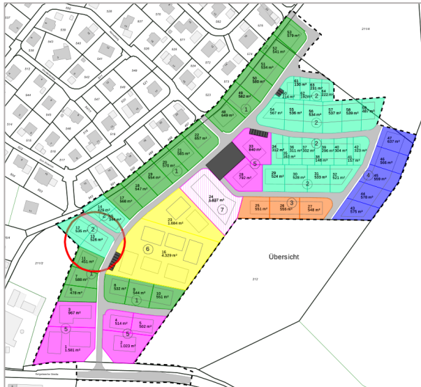
Planauszug. Den Detailplan finden Sie auf unserer Homepage.