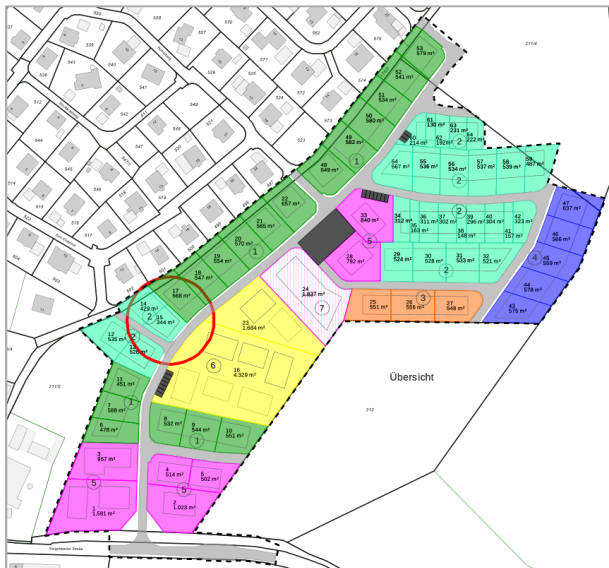
Planauszug. Den Detailplan finden Sie auf unserer Homepage.