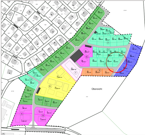
Planauszug. Den Detailplan finden Sie auf unserer Homepage.