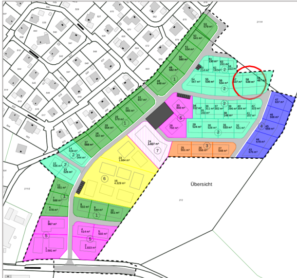
Planauszug. Den Detailplan finden Sie auf unserer Homepage.